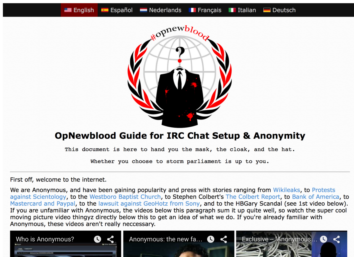
Illustration 1 : https://newblood.anonops.com , capture d'écran, 27 novembre 2015

De manière générale, la volonté de participer aux activités des Anonymous nécessite de s'impliquer dans les échanges tenus sur ces messageries, les plus connues étant accessibles via des plateformes telles que AnonOps – « ops » renvoyant ici à « opérateurs IRC » qui jouent le rôle d'administrateurs, mais dénotant également l'idée d'« opérations » conduites par le mouvement 4 . Une sous-section du site appelée « OpNewBlood » est destinée aux nouvelles recrues. Quelques faits d'armes et vidéos des Anonymous sont mis en avant, mais le site propose surtout de leur fournir « le masque, la cape et le chapeau » à travers un ensemble de tutoriels sur l'utilisation de l'IRC et l'anonymisation des communications à travers des consignes de sécurité ainsi que des conseils techniques sur l'utilisation d'outils de chiffrement (illustration 1).