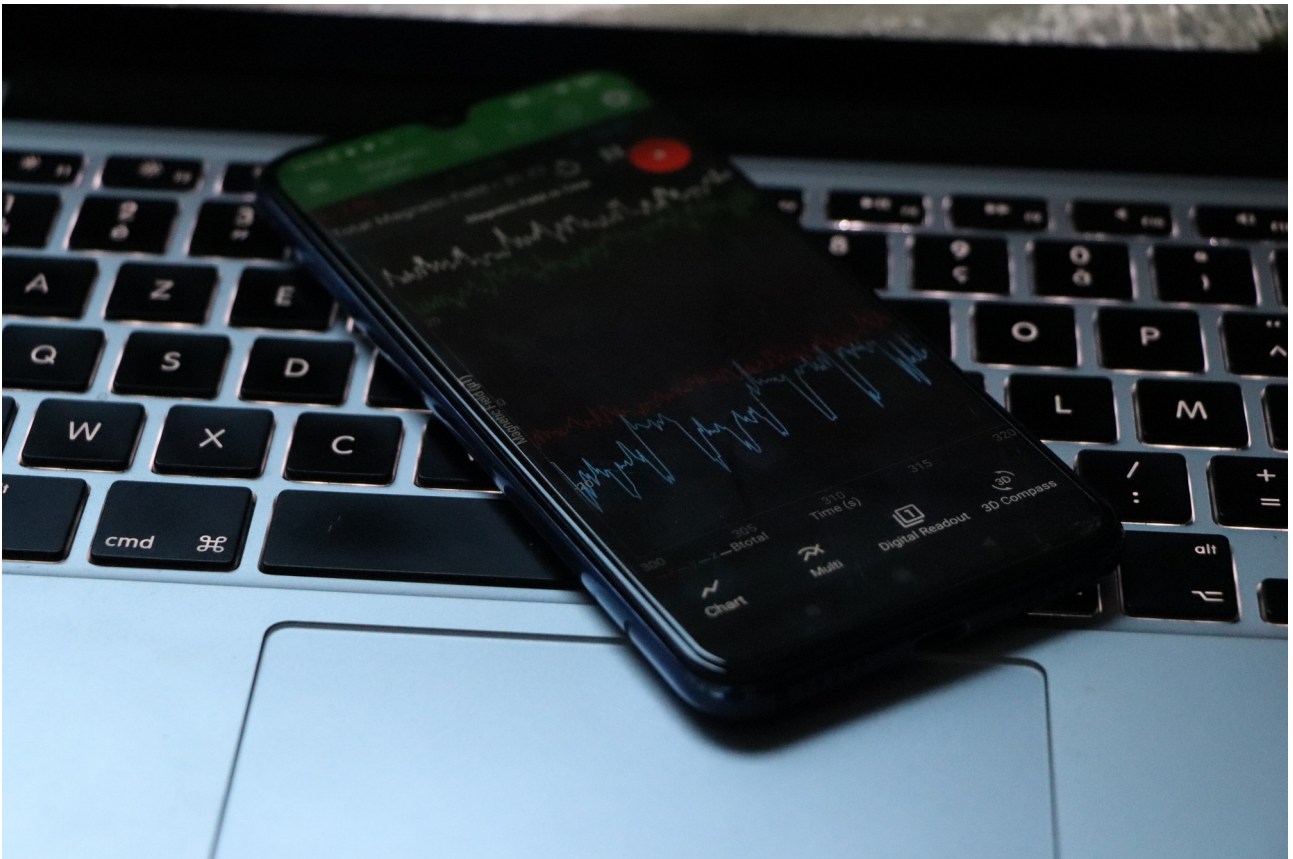
Fig. 2 : Posez votre téléphone à quelques centimètres de l'alimentation des processeurs pour relever un champ magnétique lié aux calculs effectués par votre processeur.