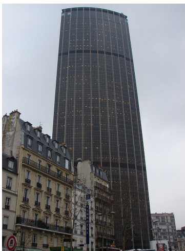
FIGURE 2 – La tour Montparnasse est le seul (ouf!) gratte-ciel de Paris. Elle mesure 210 m de haut et compte une soixantaine d'étages.

L'épaisseur après 1 pli vaut 2^1 \times 0,1 = 0,2 mm, après 2 plis, 2^2 \times 0,1 = 0,4 mm, après 3 plis, 2^3 \times 0,1 = 0,8 mm, ..., après n plis, 2^n \times 0,1 mm. On recherche le premier entier n vérifiant 2^n \times 0,000\ 1 \geq 210 , ou encore 2^n \geq 2\ 100\ 000 . Or 2^{21} = 2\ 097\ 152 et 2^{22} = 4\ 194\ 304 . C'est au 22 e pliage que la liasse dépasse la tour.