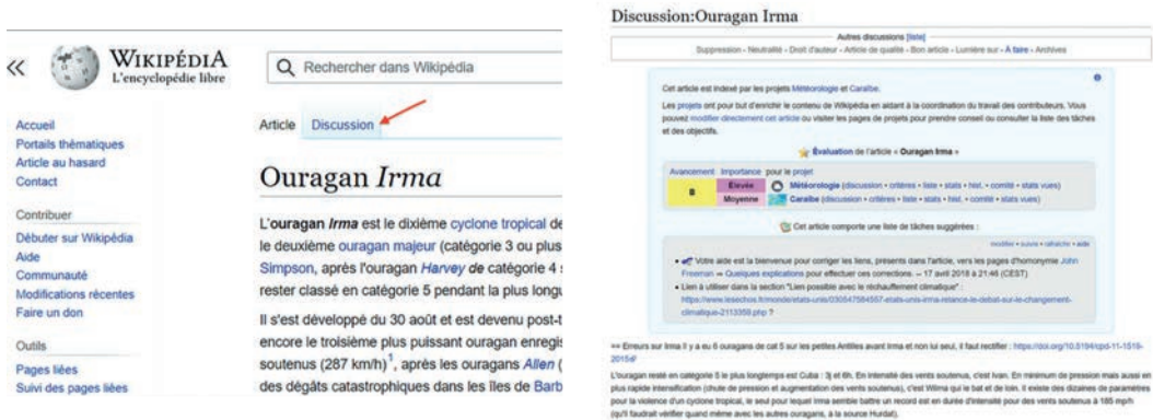
Figure 1 : Capture d'écran de la page de discussion de Wikipédia relative à l'ouragan IRMA

articles concernant des événements d'actualité (Keegan et al. , 2013). Avant d'être une encyclopédie généraliste, Wikipédia est utilisée par les internautes comme un moyen d'obtenir de l'information sur un événement en cours ou récent : c'est un lieu en ligne incontournable, quelle que soit l'actualité (décès d'une personnalité célèbre ou autre événement d'actualité). L'encyclopédie en ligne donne par ailleurs lieu à de nombreux échanges entre les contributeurs, que l'on retrouve dans les onglets « discussions » présents pour chacune des pages Wikipédia (Figure 1).